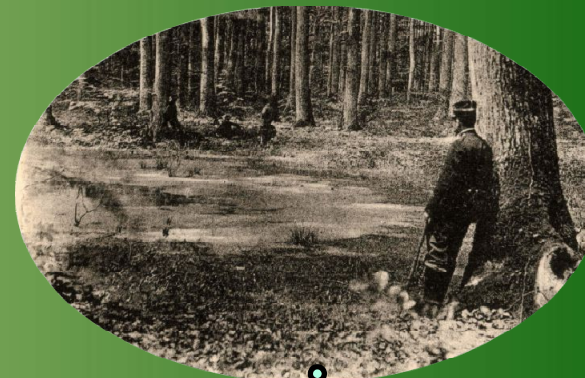
La mare du Tertre aux Bœufs Photographée vers 1900