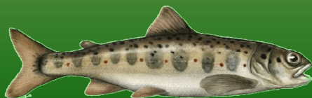
Tacon (Salmo salar)