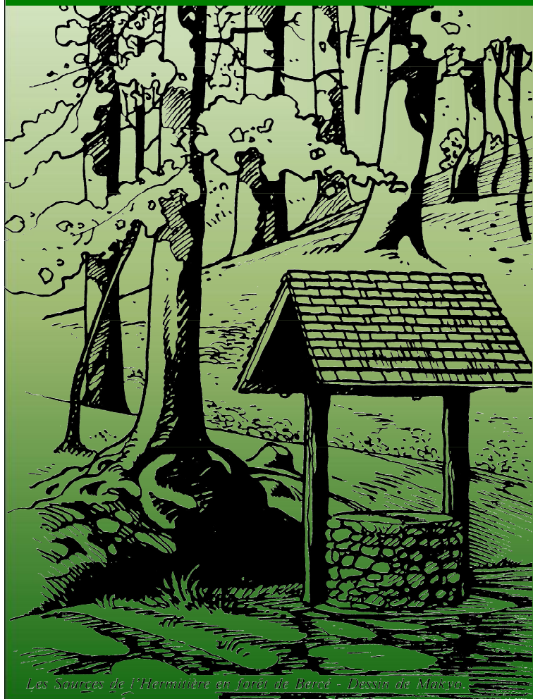
Les Sources de l'Hermitière en forêt de Bercé - Dessin de Makyo.

Les sources ou fontaines Seuls points permanents d'eau vive