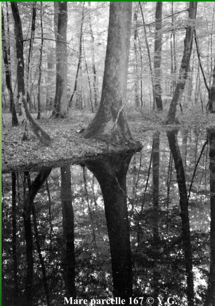
Mare parcelle 167

Le " Mortier " qui procura le fer ou la pierre, n'est lui, bien souvent, qu'une mare temporaire.