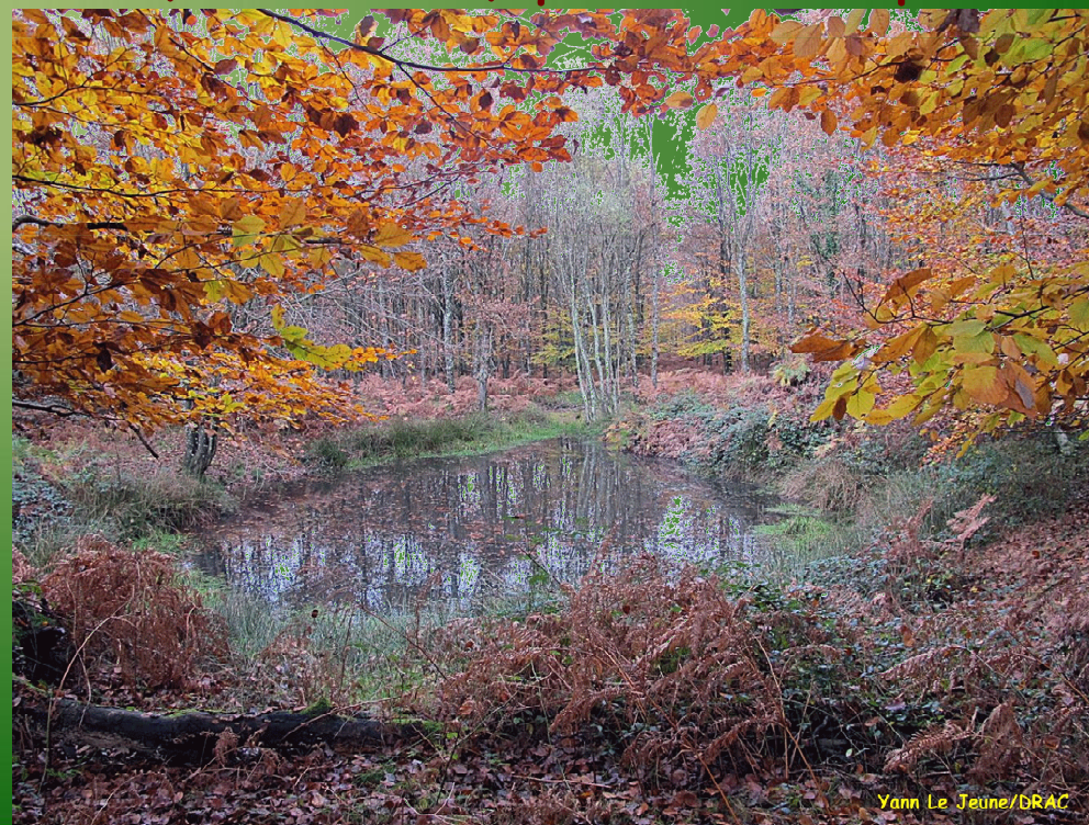
Yann Le Jeune/DRAC